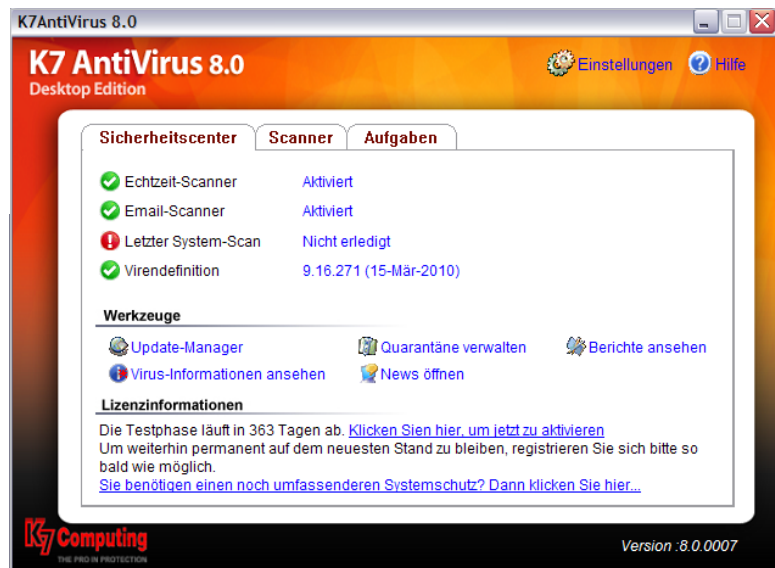
Mit K7 AntiVirus Free erhalten Sie eine sichere und kostenlose Anti-Viren-Lösung

Die Firma Proxma bietet den Lesern der webselling einen Preisnachlass von fünf Euro beim Kauf des Software K7 Total Security 10 an. Neben dem umfassenden Viren-Scan schützt Sie Total Security unter anderem vor Spam-E-Mails, befreit Ihren Rechner von Spy- und Adware und hindert Hacker durch die integrierte Firewall daran, auf Ihren Rechner zuzugreifen. Gehen Sie dazu auf die Seite www.k7.de und geben Sie beim Kauf den Gutscheincode webselling ein. Die Aktion ist bis zum 1.10.2010 befristet. (tm/cc)